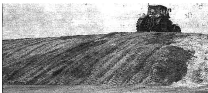
Le maïs ensilé sert à la production de biogaz.