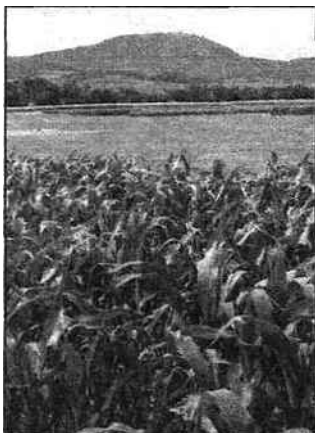
Le site se situe à la frontière entre le Haut-Rhin et le Bas-Rhin.

produire plus et mieux, du semis à la récolte”.