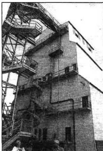
L'Alsace dispose d'une grande capacité de stockage.