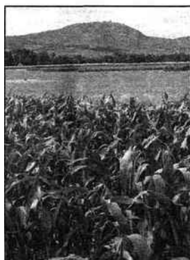
Le site se situe à la frontière entre le Haut-Rhin et le Bas-Rhin.

Les 11, 12 et 13 septembre se tiendra à Ostheim (68), un événement majeur pour la filière maïs rhénane : "Euromaïs 2009, une plante pour le futur". En juin, les différents partenaires de cette manifestation ont organisé une journée de découverte de cette filière, qui tient une place prépondérante dans l'agriculture locale.