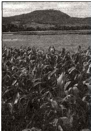
Le site se situe à la frontière entre le Haut-Rhin et le Bas-Rhin.

produire plus et mieux, du semis à la récolte”.