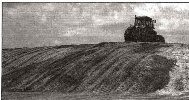
Le maïs ensilé sert à la production de biogaz.