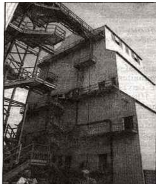
L'Alsace dispose d'une grande capacité de stockage.

Le pôle génétique et biotechnologie montrera comment le maïs est amélioré, des maïs originaux, et abordera la question des OGM