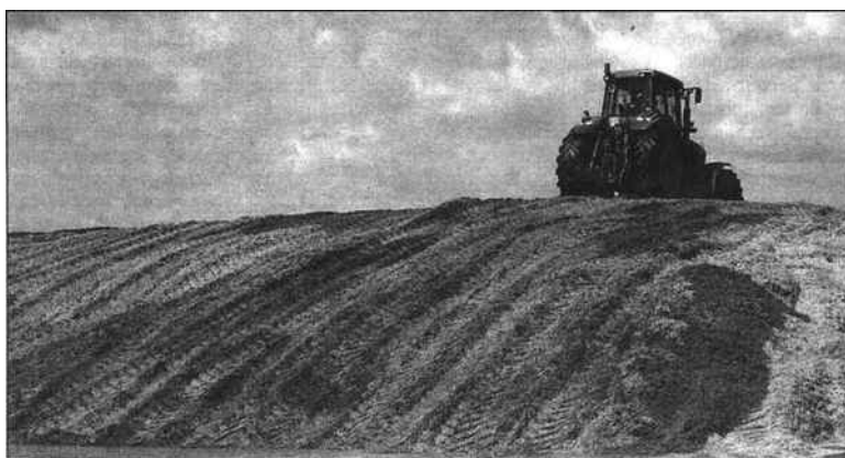
Le maïs ensilé sert à la production de biogaz.