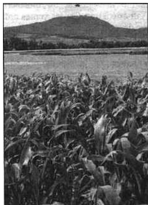
Le site se situe à la frontière entre le Haut-Rhin et le Bas-Rhin.